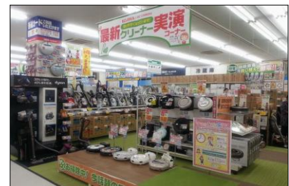
掃除機実演コーナーの展開例