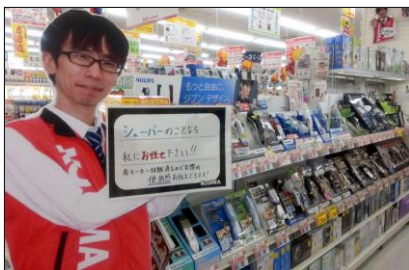
等身大 POP 展開例

また、最新家電を比較・体感できるコーナーを店内に数多く設置するなど、“体験提案型”売場へと刷新いたします。