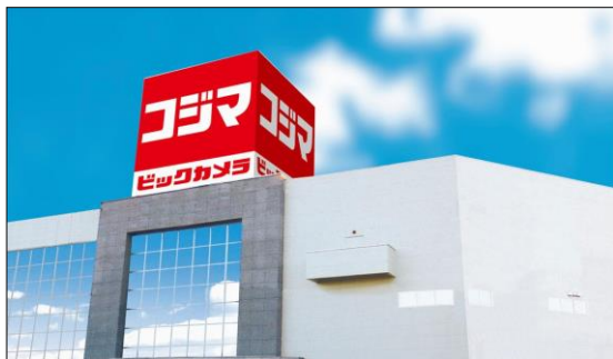
コジマ×ビックカメラ 越谷店イメージ

ビックカメラのコーポレートカラーである赤と白をベースとした連名看板と新しい制服を導入いたします。