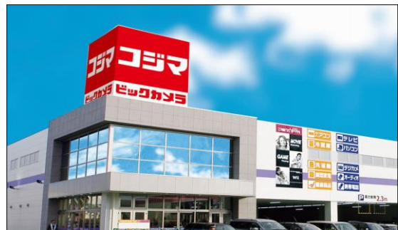
コジマ×ビックカメラ 新船橋店イメージ