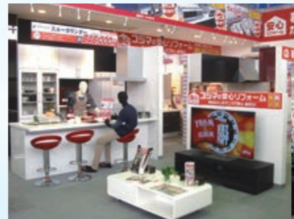
▲コジマ初の総合リフォーム専門コーナーを設置！家電はもちろん、修繕・リフォーム、太陽光発電やオール電化のご相談など、ご自宅のお悩みをまるごと解決いたします！