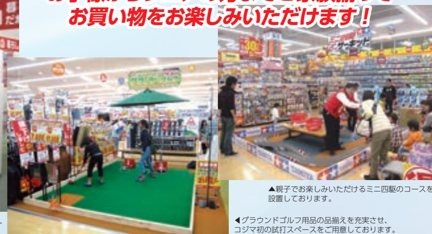
▲親子でお楽しみいただけるミニ四駆のコースを設置しております。