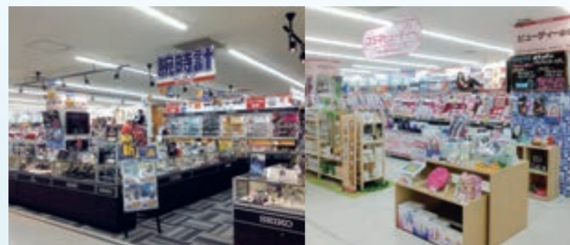
▲時計専門コーナー、国内外の時計を多数取り揃えております。 ▲実際に体験できるビューティー家電コーナー、品揃えも豊富です！

2015年9月、横浜市の商業施設「港北東急S.C.」内に、「コジマ×ビックカメラ 港北東急S.C.店」をオープンしました。都市部をターゲットとした新たな出店計画の第1弾であり、商業施設内の店舗では首都圏最大となる約2,900平方メートルの売り場面積を誇ります。家電製品はもちろんのこと、時計専門コーナーを設置し、国内外の高級時計なども取り扱うなど、都市部の多様なお客様のニーズに応えてまいります。